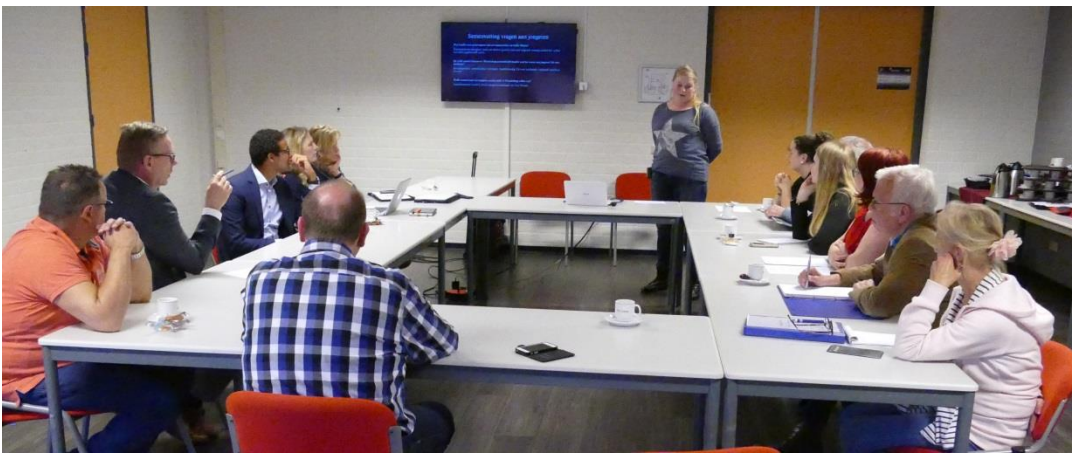
De Jongerengroep presenteert het advies aan het bestuur van de HBVW.

huurders verbreden we onze horizon, zodat we slagvaardig landelijke en lokale ontwikkelingen het hoofd kunnen bieden. Door het versterken van onze positie in de samenleving staat de kracht van huurders steeds centraal. Voor ons telt de mening en denkrichting van alle huurders in Woudenberg.'